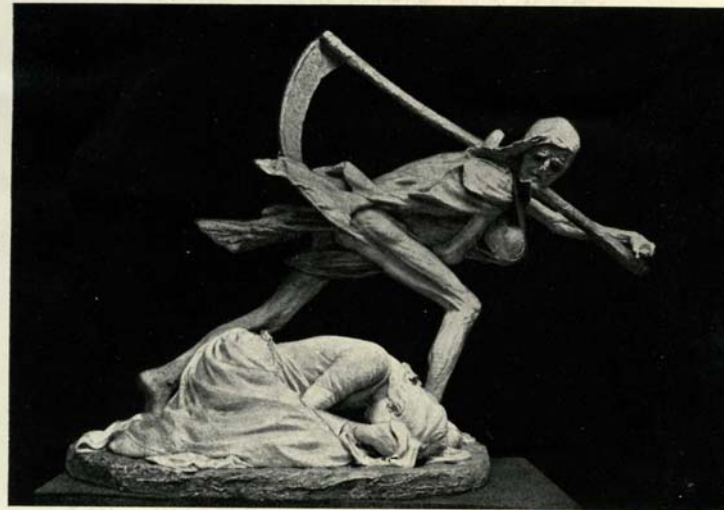
Døden og Moderen.