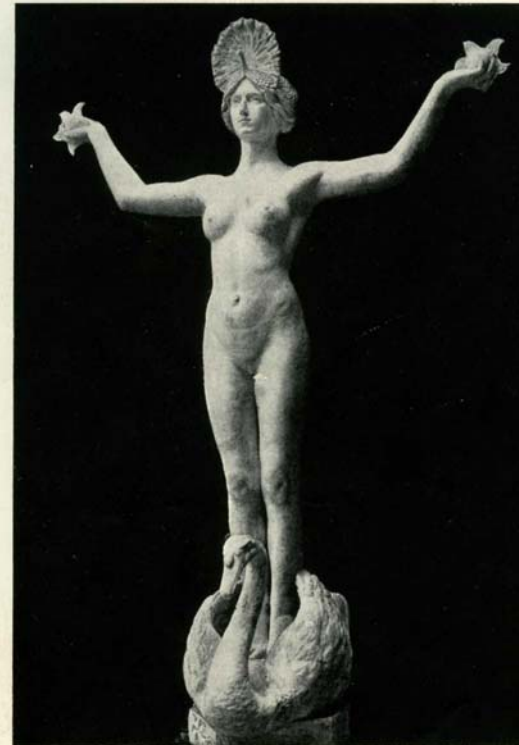
Den ukendte Stjerne.