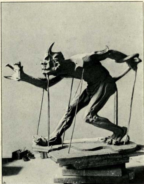
En Troid, der lugter Menneskekød.